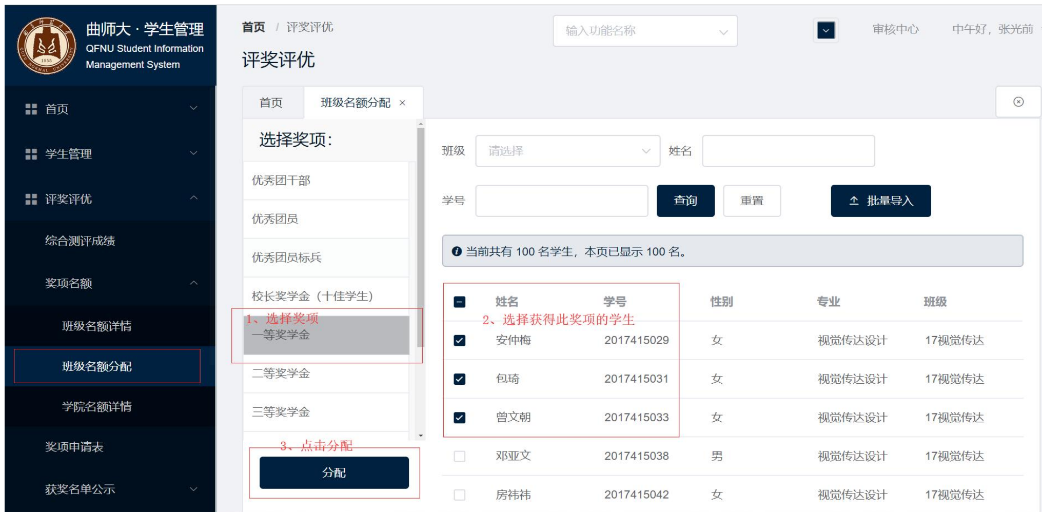
图 2、奖项名额手动分配